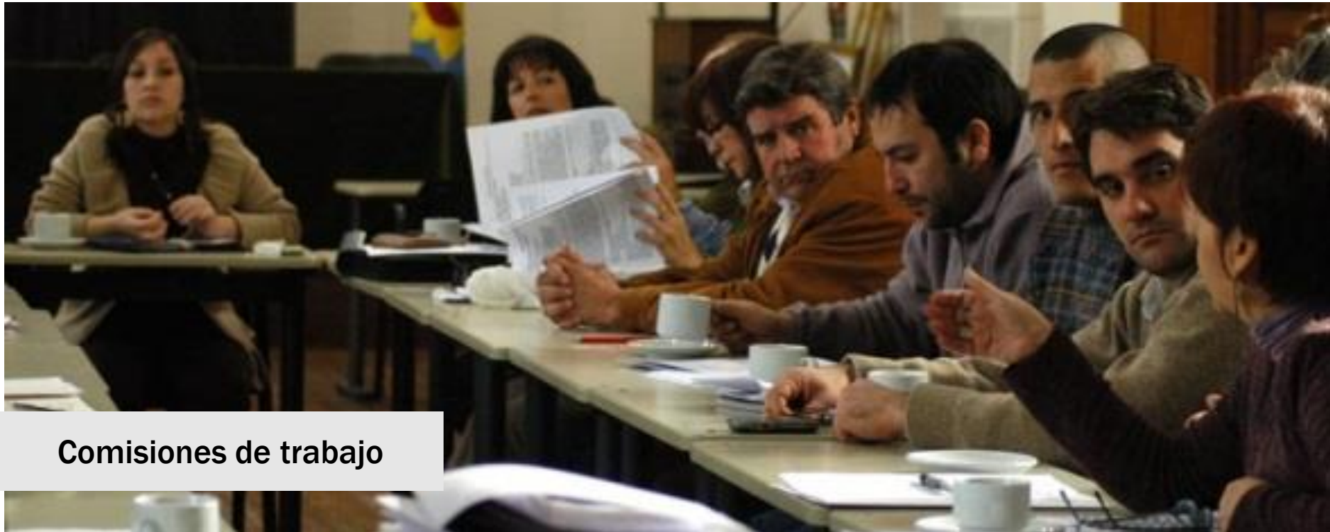
Comisiones de trabajo