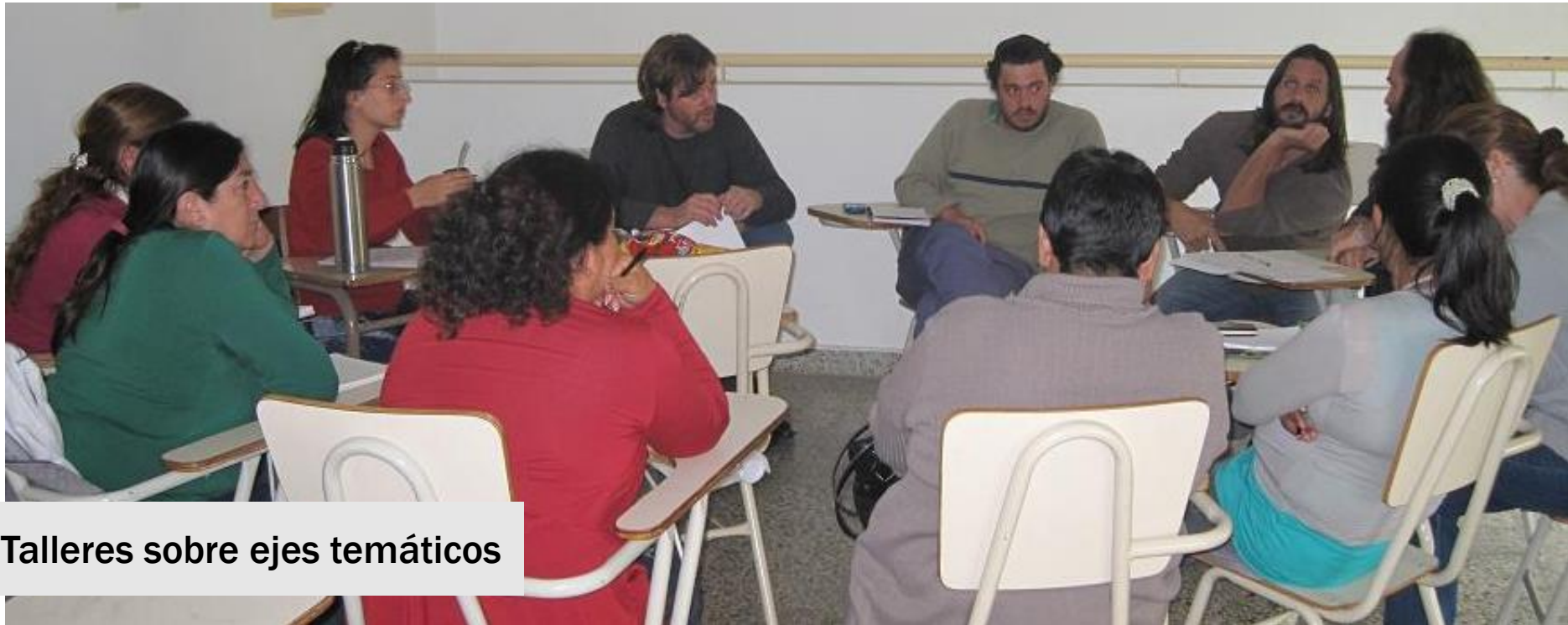
Talleres sobre ejes temáticos