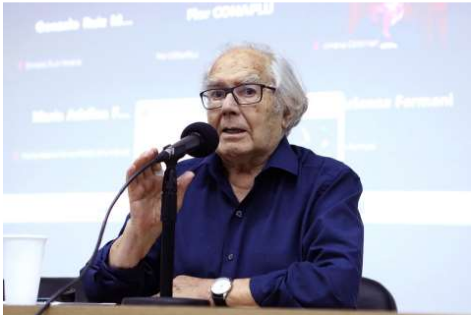
Adolfo Pérez Esquivel